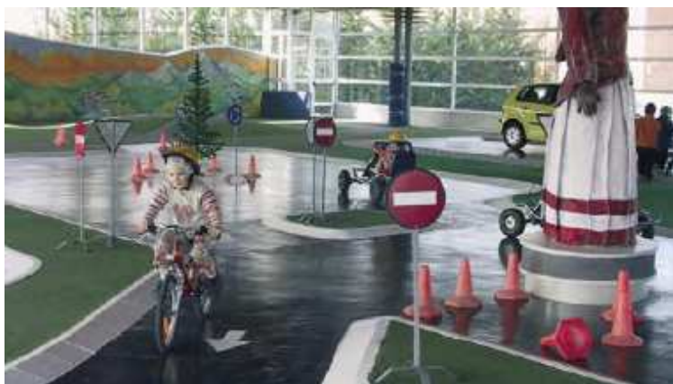
5. ábra: Közlekedési park gyerekeknek

Egy nagyon szép CSR tevékenység egyes autógyárak részéről, hogy közlekedési (KRESZ) parkokat hoznak létre gyerekek számára, hogy minél kisebb korban megtanulják a helyes közlekedési szabályokat (5. ábra). Nemcsak a parkok létrehozásában tevékenyek a gyárak, hanem azok üzemeltetését is finanszírozzák