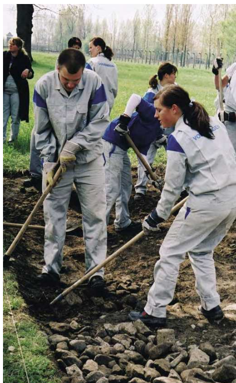
8. ábra: Közös német-lengyel diákmunka Auschwitzban