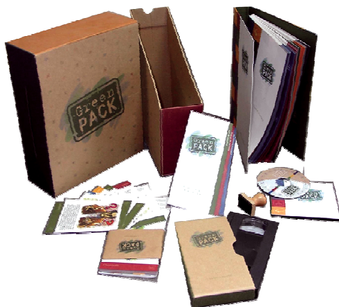
4. ábra: „Green Pack” - Toyota

E területre minden autógyár nagymértékben fókuszál. A 4. ábra a Toyota példáját mutatja be, amely szerint a gépkocsihoz tartozó minden papír (kezelési utasítás, dossziék, tokok, stb.) újrahasznosított és lebontható klórmentes papírból készült.