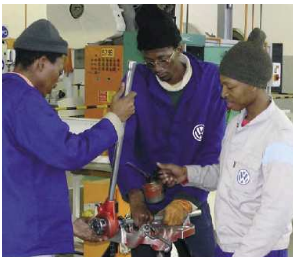
10. ábra: Új munkavállalók képzése Dél-Afrikában