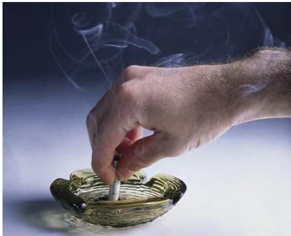
6. ábra: Dohányzás elleni kampány

Az egészséges életmód támogatására is irányul számtalan CSR kezdeményezés. Sok példát lehet említeni, de nézzük meg például a Seat CSR akcióját. A statisztikák szerint Spanyolországban a lakosság egyharmada, 12 millió ember dohányzik. Évente 19 ezer ember hal meg tüdőrákban. A Seat dohányzás elleni kampányt szervez és finanszíroz, hogy a halálzási mutatók kedvezőbbé váljanak [5] (6. ábra).