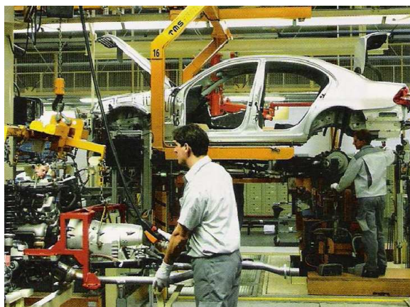
1. ábra: Autóösszeszerelés

A nemzetközi autóipar nem csak mint húzóiparág, hanem mint a világ legnagyobb iparága is odafigyelést igényel. A fejlett világban minden negyedik család valamilyen fokon érintett a szektor változásaiban. Megdöbbentő adat, miszerint a globális autóiparban egy évben 3 ezer milliárd euro termelődik meg [10]. Ez egy óriási szám, Magyarországnak kb. 30 évnyi teljes GDP-je.