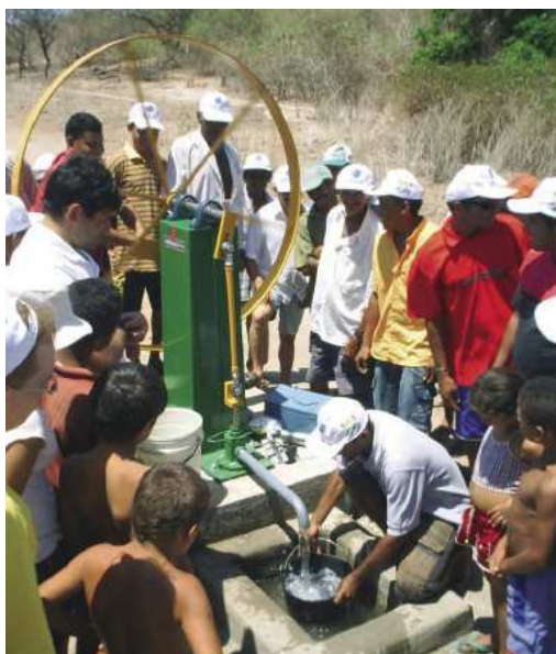
11. ábra: Új ivókút átadása Brazíliában

Nagyon fontos társadalmi szerepvállalás a Daimler részéről, hogy Brazíliában ivókutakat létesít a helyi szegény lakosság részére, akik egyébként nagyon fáradtságos munkával jutnának különben a létfenntartáshoz elkerülhetetlenül szükséges forráshoz [9] (11. ábra).