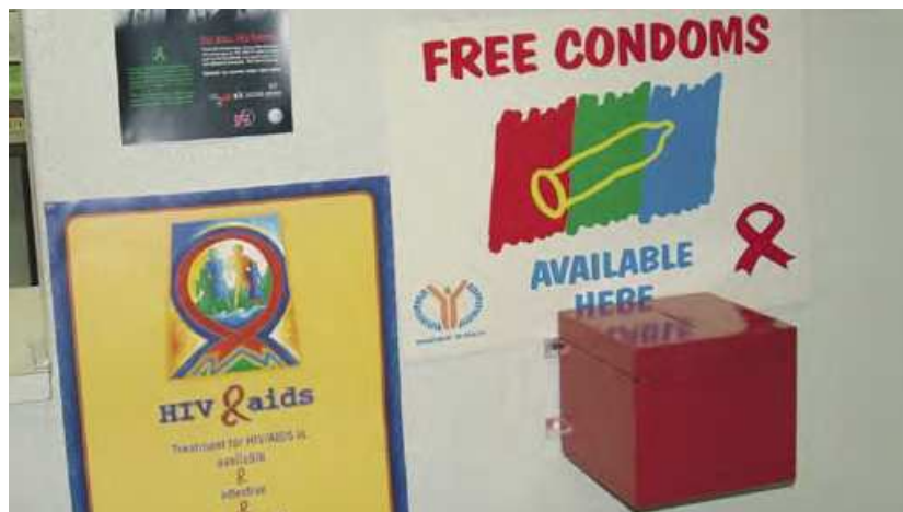
7. ábra: Aids elleni kampány

Egy másik, BMW-s példa az Aids ellen próbál küzdeni azzal, hogy dél-afrikai gyárában ingyenes óvszerautomatákat helyez ki [8] (7. ábra).