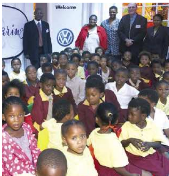
9. ábra: Új iskola Dél-Afrikában

Egy igen nemes CSR projekt volt a Volkswagen részéről, hogy Dél-Afrikában régi tengeri konténerekből iskolatermeket rendeztek be, hogy a helyi szegény gyerekek is iskolába tudjanak járni. Mindezen jótéteményhez még könyvadományok és ösztöndíjak is társulnak [5] (9. ábra).