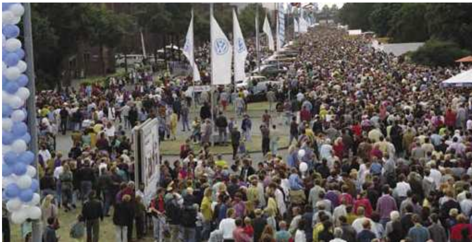
3. ábra: Családi nap a Volkswagennél

A politikai nyitás után számtalan autógyár döntött úgy, hogy telephelyet létesít valamely olcsóbb költségű országban, így Közép-Kelet-Európában is. A dolgozók természetesen mindig tartanak attól, hogy saját munkahelyük is megszűnik. A feszültség oldására a cégmenedzsment időben ellátja információkkal a munkavállalókat, másrészt például családi napot szervez a cégnél, biztosítva az összetartozás és szolidaritás érzését az egész családban (3. ábra).